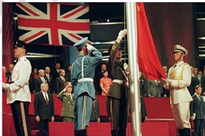
Hình 4: Trung Quốc thu hồi chủ quyền với Hồng Kông (1997)