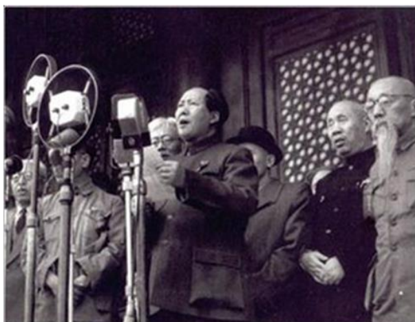
Hình 2: Chủ tịch Mao Trạch Đông tuyên bố thành lập nước Cộng Hòa nhân dân Trung Hoa